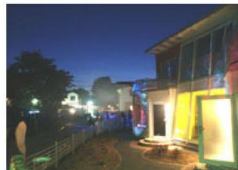
Eröffnung der LGM-Klanggalerie in Ahrenshoop 2005

Pressestimmen zu LGM-Projekten: „Ruhe und Harmonie und doch keine Banalitäten“ (Neue Westfälische) , „unorthodox und voll kecker Ideen“ (Saarlouiser Rundschau) , „sensitive and delicate Instrumentals“ (Blue Juice) , „romantische Momente und furiose Instrumentalparts“ (Magdeburger Volksstimme) , „eine musikalische Reise durch die Lüfte eines herbstlichen Himmels“ (Folksblatt) , „intelligente ‘Bauchmusik’ zum Abheben“ (Mitteldeutsche Zeitung) , „Hier ist man sicher vor Plattitüden! Fundiertes instrumentales Können sorgt dafür, daß jedes Stück eine solide Grundlage erhält.“ (Express Marburg) , „Ohrenstreichleinheiten für Hektik- und Streßgeplagte“ (Frankfurter Allgemeine Zeitung)